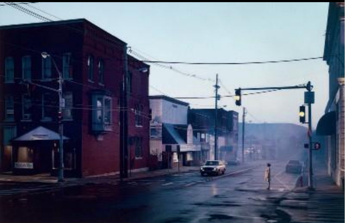
Beneath the roses , Gregory Crewdson