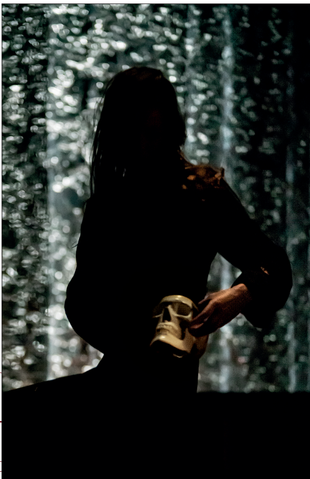
Seul ce qui brûle