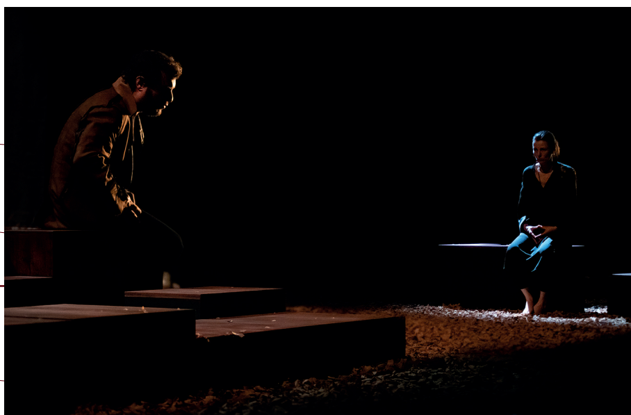
Seul ce qui brûle © Yannick Pirot