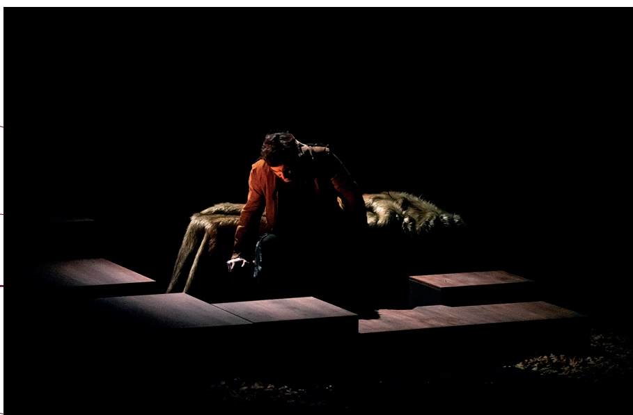
Seul ce qui brûle © Yannick Pirot