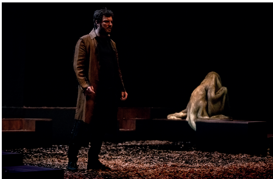
Seul ce qui brûle