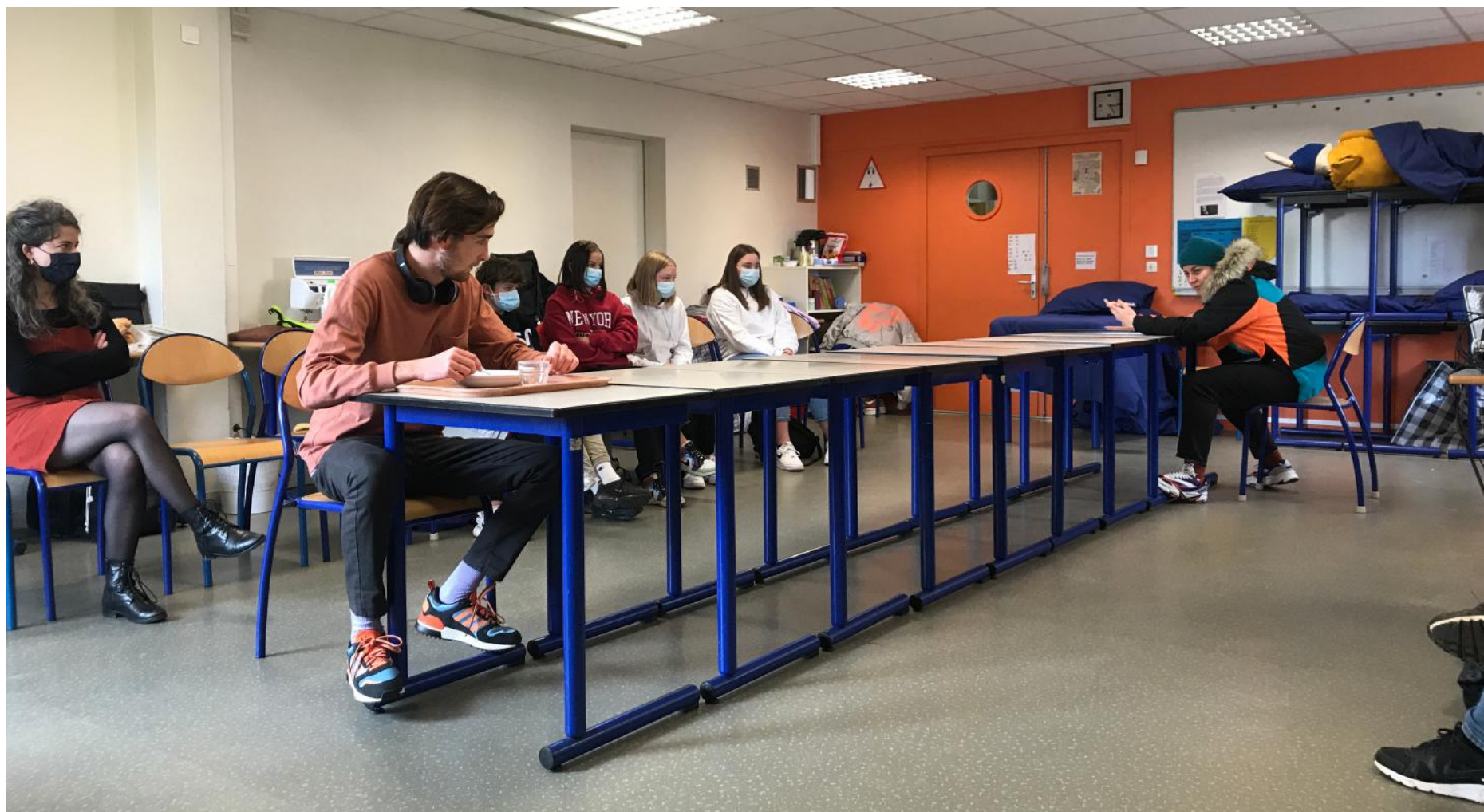
Répétition publique au collège Tancrede de Hauteville de Saint Sauveur Lendelin