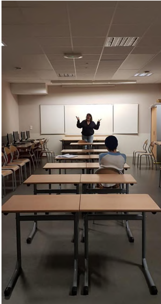
Répétition au collège Sévigné de Flers