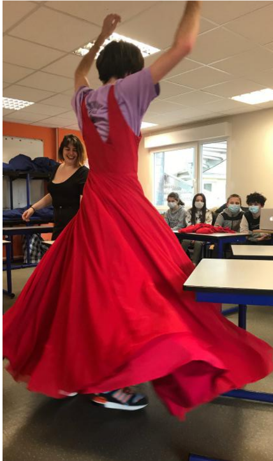
Répétition publique au collège Tancrede de Hauteville de Saint Sauveur Lendelin