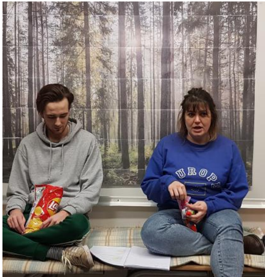
Répétition au collège Sévigné de Flers