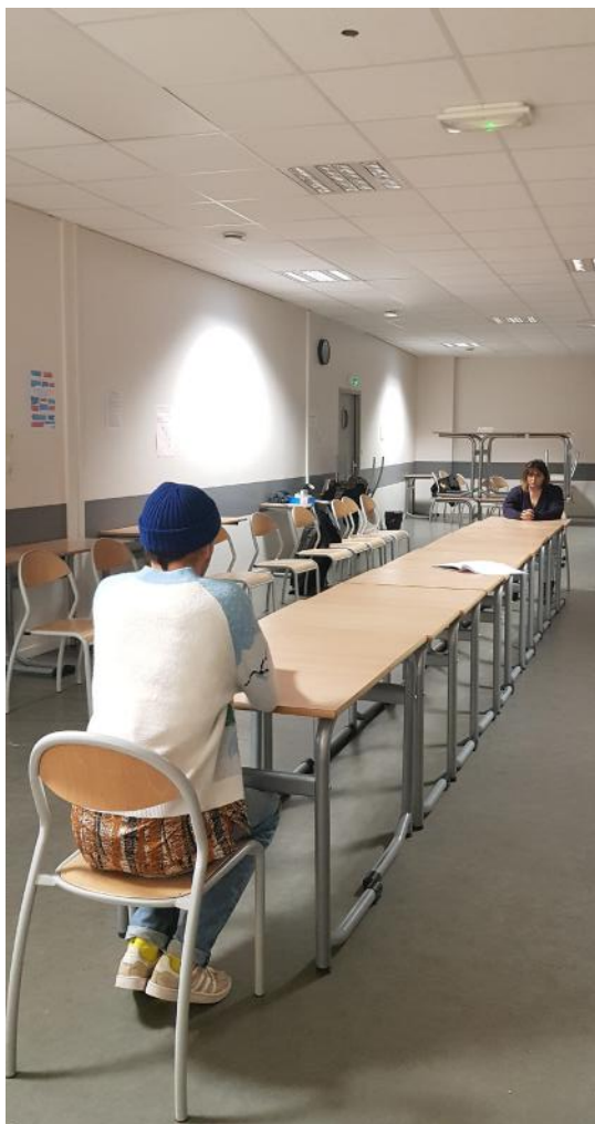
Répétition au collège Sévigné de Flers

ces personnages, d'accompagner l'enquête en lui donnant une dramaturgie forte emprunté à l'esthétique cinématographique et sérielle, utilisant des procédés tels que le flashback, le hors champ, ou l'arrêt sur image.