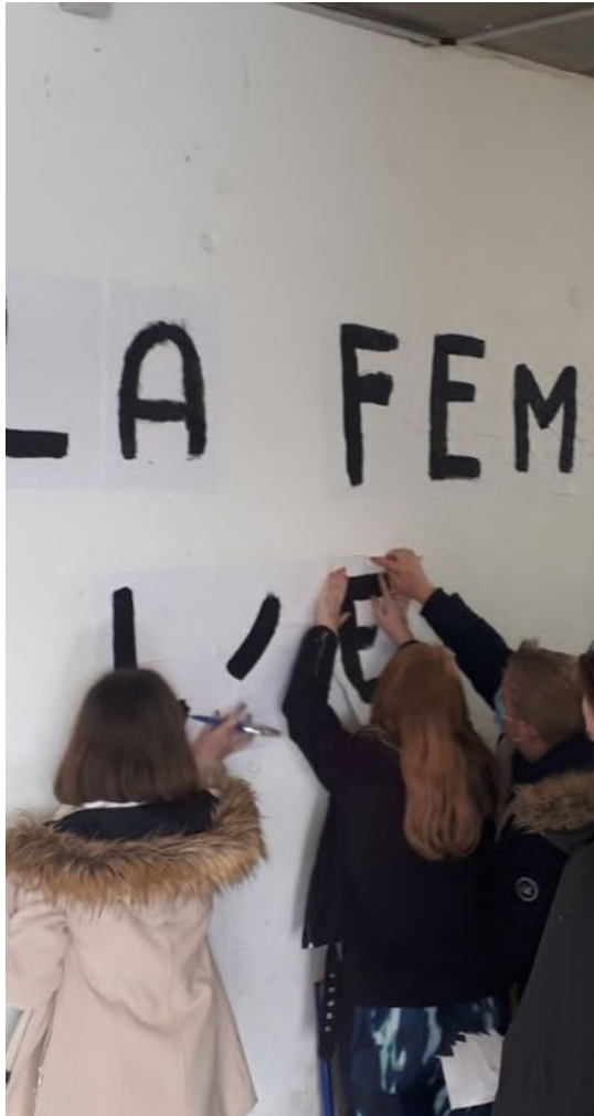
Séance de collage avec les collégien.nes du collège Gabriel de Montgomery de Ducey-les-chéris