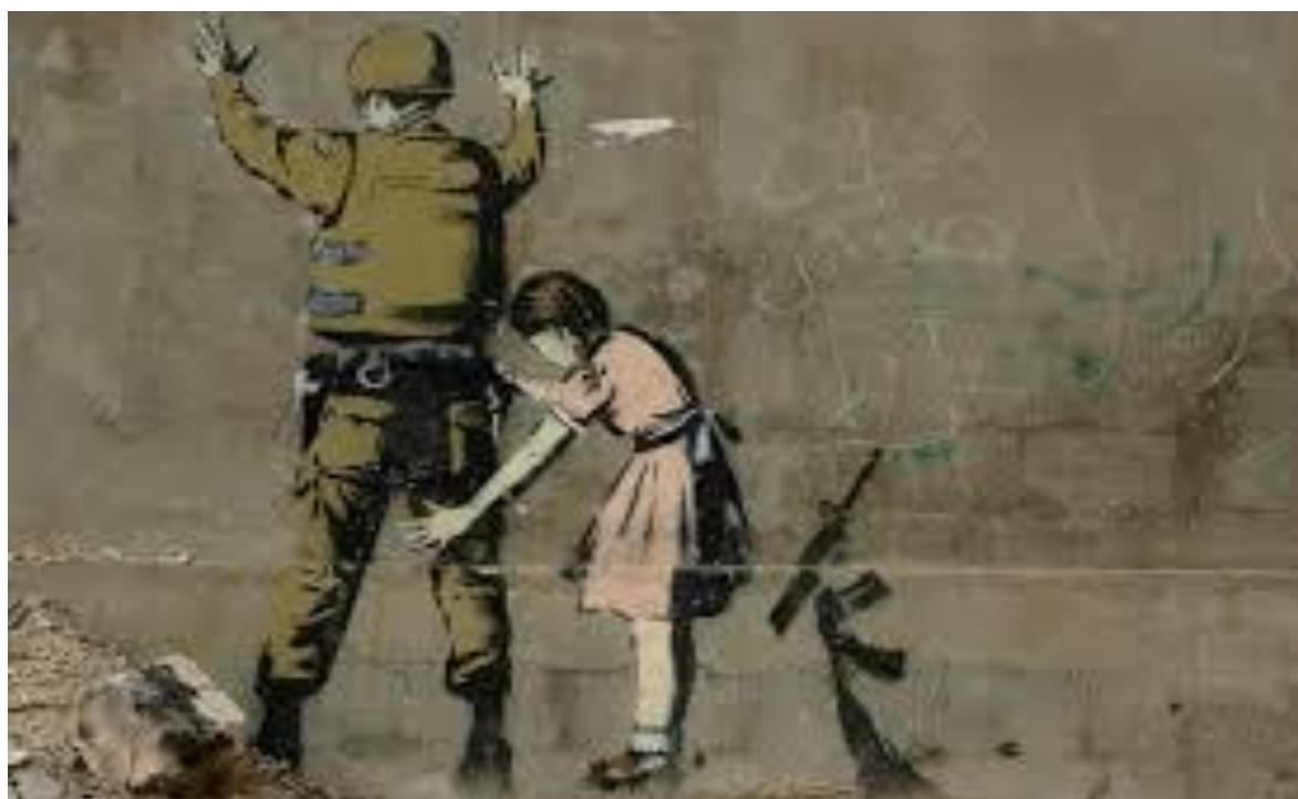
La Petite Fille et le Soldat - Banksy

Suivant le fil rouge de contes initiatiques, racontés et revisités par la sœur aînée, Mike Kenny nous entraîne, avec un grand suspense, et de l'humour, sur les traces de ces trois sœurs et de leur découverte de la liberté.