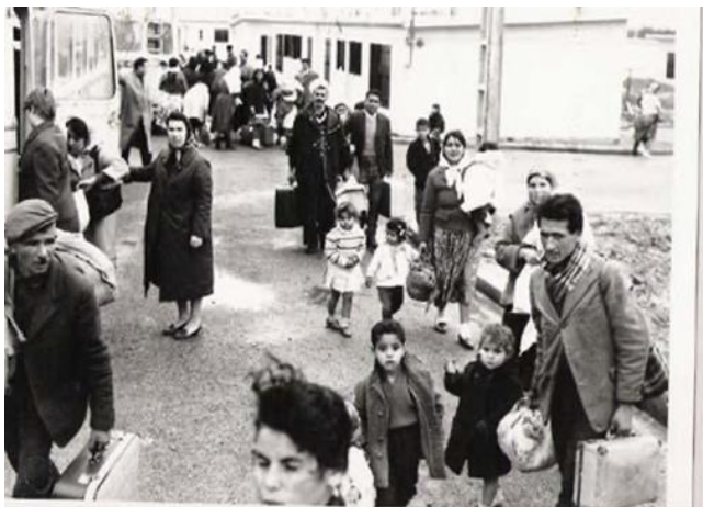
Arrivée dans le Camp de Rivesaltes.