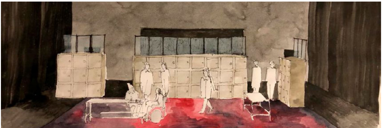
Dessins d'études pour la scénographie - Irène Vignaud