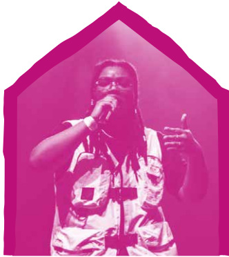
R'May • SR • Kankun • Kenito • Monument POUR UNE SOIRÉE RAP