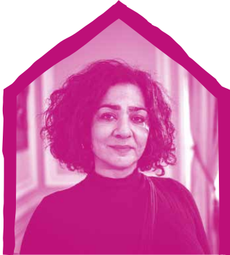
Dima Abdallah POUR LE TEXTE