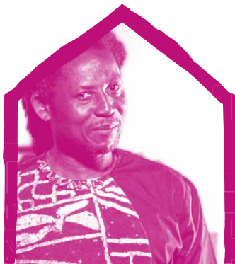
Eric Delphin Kwégoué POUR LE TEXTE & MISE EN SCÈNE