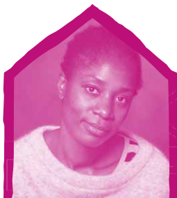
Rosine Mbakam POUR LE FILM