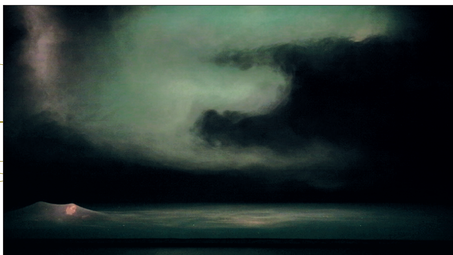
Je suis la bête