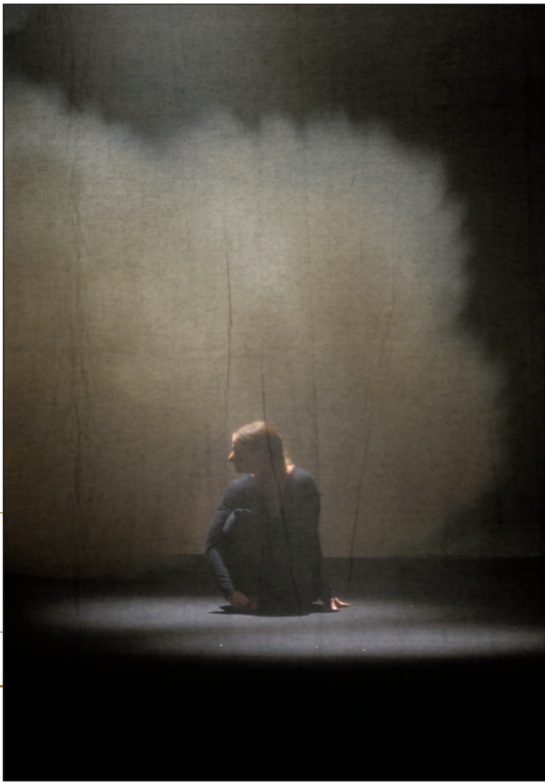
Je suis la bête © Clémence Delille