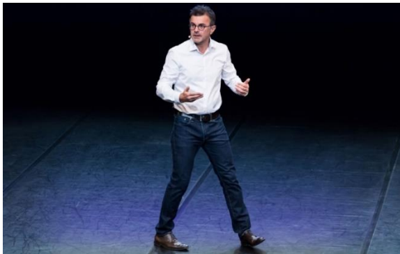
Le tennis de table

Compagnie Vertical Détour – Frédéric Ferrer