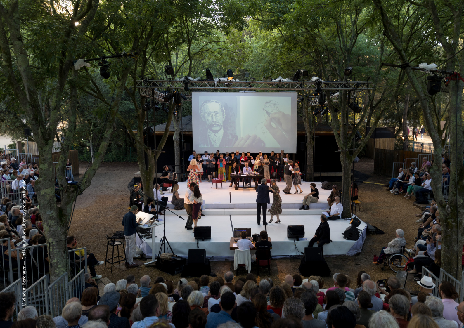
© Vincent Berengier — Châteauvallon-Liberté, scène nationale