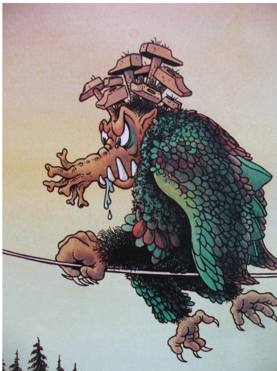
Okilélé , le monstre

Pour Claude Ponti, dire la vérité sur la cruauté du monde aux enfants est essentiel pourvu que les choses soient abordées avec des métaphores, de l'humour et de la fantaisie. Il vaut mieux aider les enfants à s'armer face aux personnes malveillantes ou des situations difficiles auxquelles ils vont devoir parfois faire face tout seul. Claude Ponti l'explique très bien lorsqu'il prend l'exemple d'un enfant à qui l'on ordonne de ne pas parler aux inconnus alors que les maltraitances sont commises à plus de 60% au sein de la famille. Il est nécessaire d'appeler les choses par leur nom. En montant Okilélé nous faisons le choix d'aborder des sujets rarement traités pour les jeunes enfants mais dont l'importance nous semble essentielle pour accompagner les enfants dans leur développement. Comme le dit Claude Ponti "A quoi ça sert de grandir si c'est pour rester petit !"