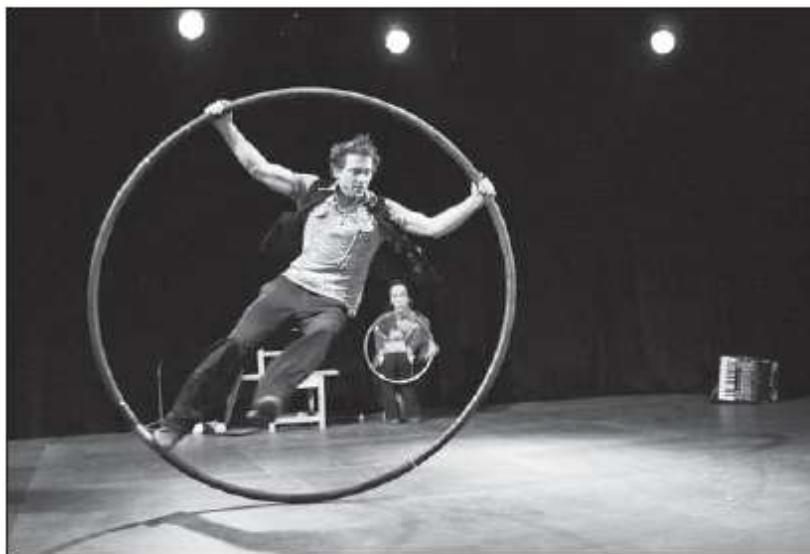
La compagnie haut-viennoise le Cirque Sans Noms est en Argentine au moins jusqu'au 27 novembre.