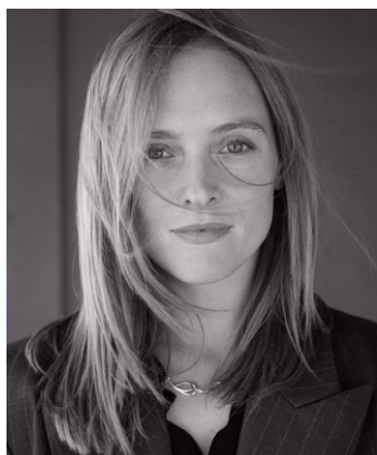
La Femme de ménage et l'Enfant