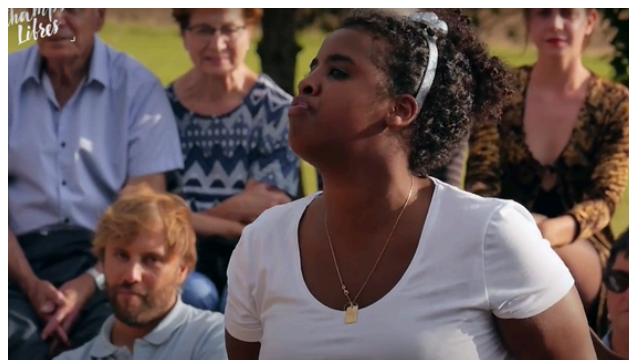
“Un tartuffe” version TT.