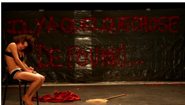
« Hamlet fragments »

“Un tartuffe”, d'après Molière 2017, La loge, Festival PAMPA, ON arrête pas le théâtre. Création Tout terrain en tournée dans des lieux non dédiés.