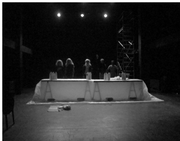
Hamlet L'acte II