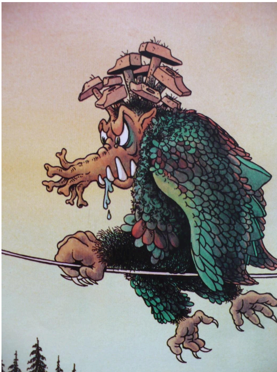
Okilélé , le monstre

Pour Claude Ponti, dire la vérité sur la cruauté du monde aux enfants est essentiel pourvu que les choses soient abordées avec des métaphores, de l'humour et de la fantaisie. Il vaut mieux aider les enfants à s'armer face aux personnes malveillantes ou des situations difficiles auxquelles ils vont devoir parfois faire face tout seul. Claude Ponti l'explique très bien lorsqu'il prend l'exemple d'un enfant à qui l'on ordonne de ne pas parler aux inconnus alors que les maltraitances sont commises à plus de 60% au sein de la famille. Il est nécessaire d'appeler les choses par leur nom. En montant Okilélé nous faisons le choix d'aborder des sujets rarement traités pour les jeunes enfants mais dont l'importance nous semble essentielle pour accompagner les enfants dans leur développement. Comme le dit Claude Ponti "A quoi ça sert de grandir si c'est pour rester petit !"